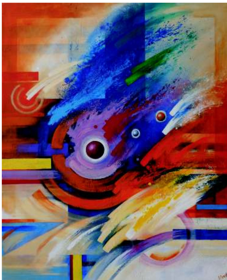
Ve ká oslava akryl na plátne (110x90)cm, 2015