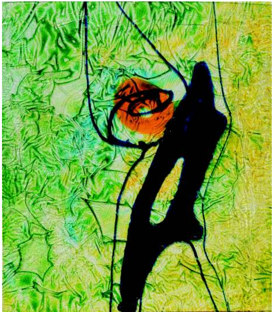
Romantický večer polymethylmetacrylate (70x50)cm, 2013