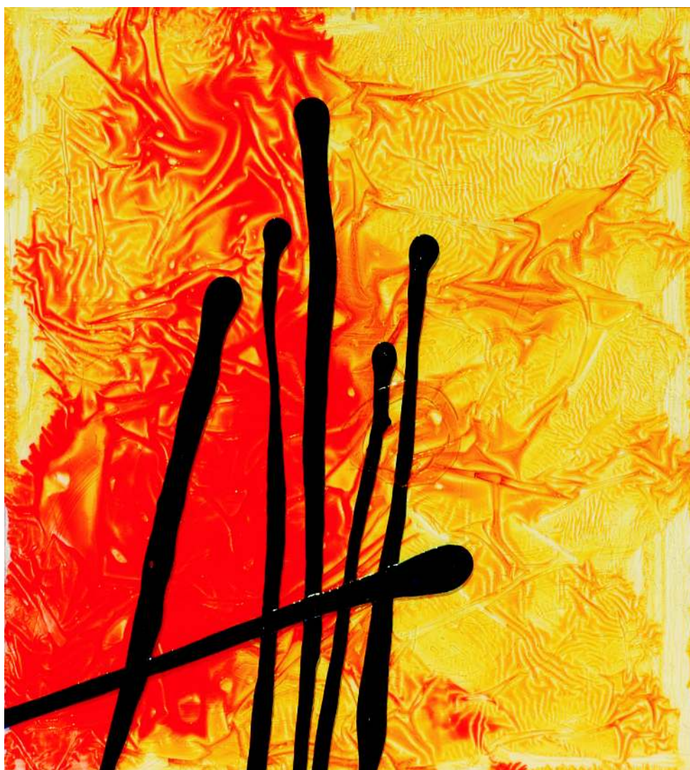
Horúci de polymethylmetacrylate (70x50)cm, 2013