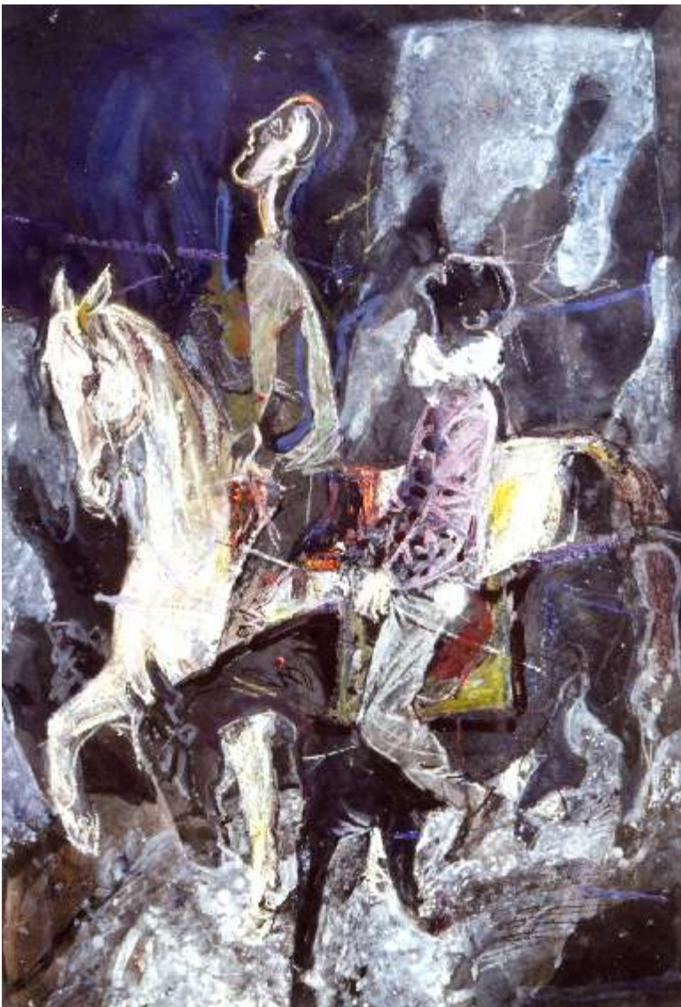
Dvaja klauni na koňoch komb. technika na papieri ( 61 x 42)cm, 2004