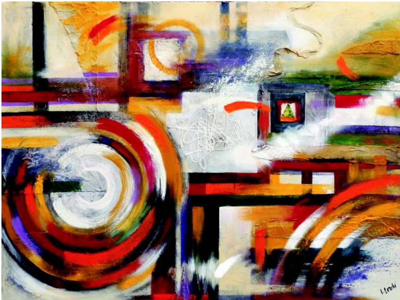
Tajomstvo zamotaných snov 2 akryl na plátne (90x120)cm, 2015