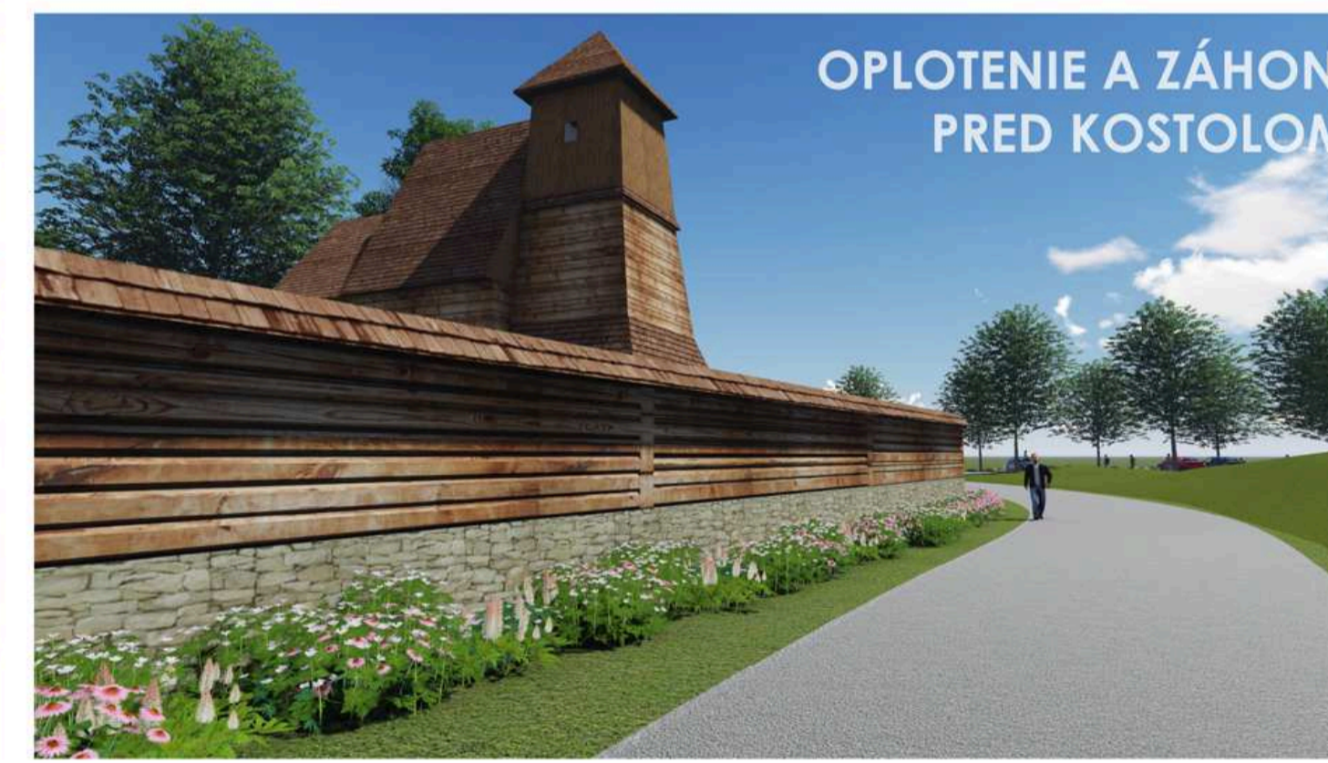
OPLOTENIE A ZÁHON PRED KOSTOLOM