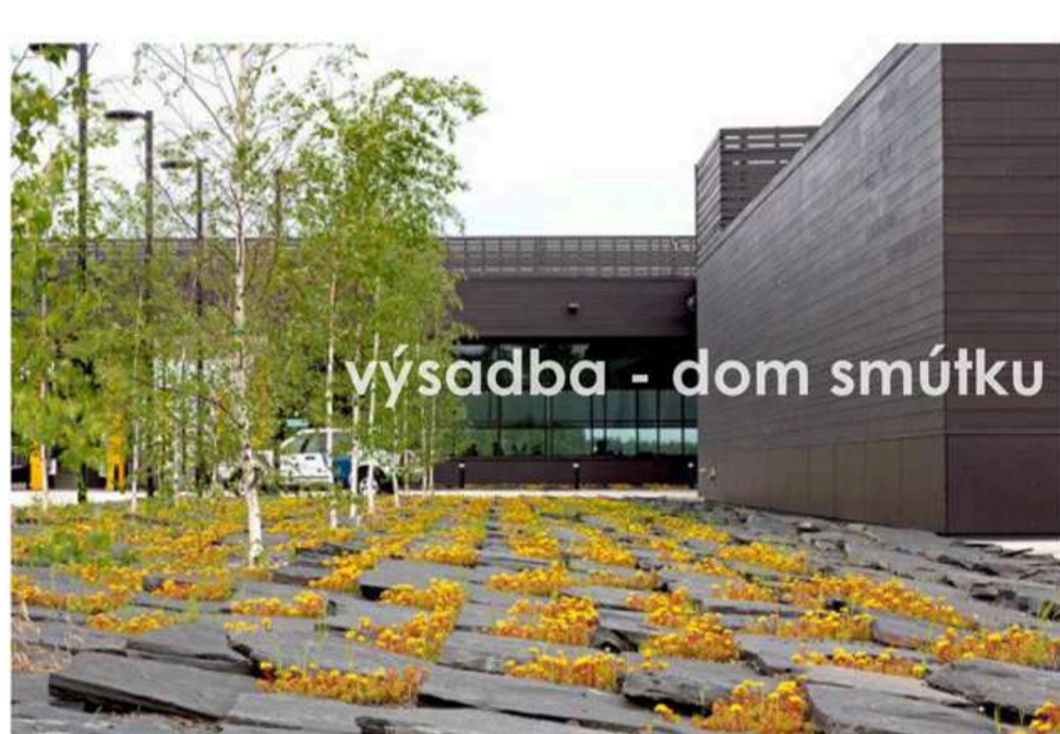
výsadba - dom smútku