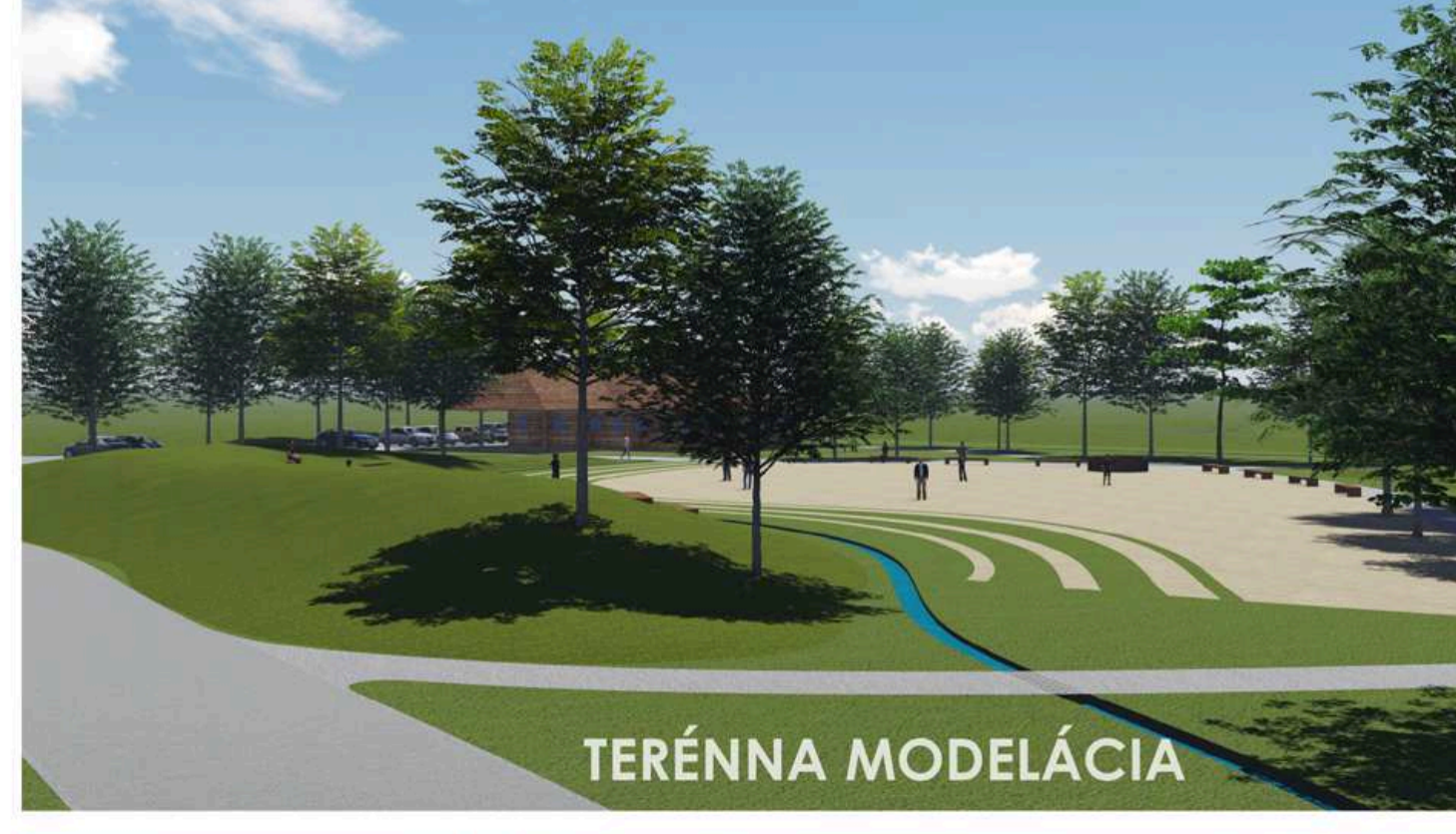
MIESTO NA STRETNUTIE